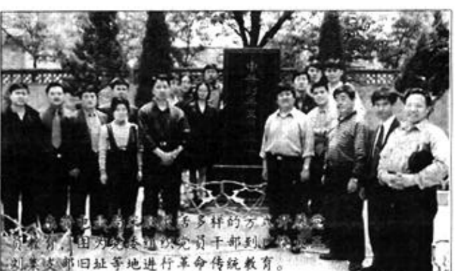
局党委组织干部职工到革命传统教育基地进行革命传统教育。

扎实细致的党建、思想政治工作不断为东营电力注入着新的血液。目前，东营电业局党委正带领干部职工紧密结合东营实际，制订东营电力“十五”发展规划，以饱满的热情，崭新的姿态，投身于东营电力建设事业，为油田建设与发展服务，为全市大开发、大发展服务，为建设黄河三角洲高效生态经济的宏伟事业服务。