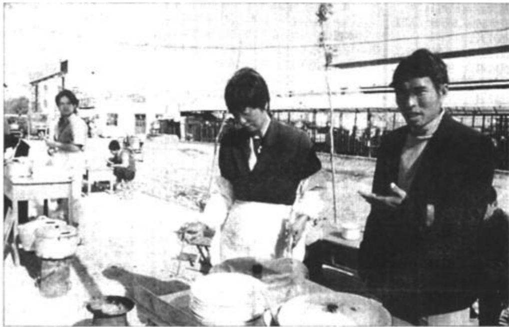
东营区牛庄镇在招商引资工作中,狠抓城镇建设,改善投资环境,吸引了众多的个体户来这里投资,今年新增个体户60多户。这位来自陕西的个体户(右一)说:“牛庄是个好地方,我们来这里做买卖很安心。”

河口讯 河口区把招商引资、发展个体私营经济作为实现全区经济目标的重要措施,作为富区富财政的重要突破口,作为农民致富奔小康的重要途径,实施政策牵动、市场拉动、服务促动、典型带动战略,有力地促进了全区个体私营经济的发展。目前,全区个体工商户已发展到5839户,从业人员11234人,私营企业达247家,雇工2953人。他们一是抓政策,宽松和谐促发展。这个区把发展个体私营经济作为全区经济工作的重要组成部分,每年都组织各乡镇党委、政府和区直有关部门的负责同志及个体、私营大户到温州、大庆、公主岭等经济发达地区参观学习,并研究出台激励政策。使全区个体、私营经济成为最具活力、最富有生命力的经济增长点之一。二是抓市场,完善体系促发展。按照“发展大市场,搞活大流通,形成大产业”的总体思路,大力推进市场体系建设。目前,全区共有各类市场22处,其中综合集贸市场16处,专业批发市场6处,年成交额1亿多元。为加大市场监管力度,成立了由工商、公安、税务等部门组成的市场管理办公室,对各类专业批发市场实行扎口管理,为经营者提供了良好的市场环境。三是抓服务,优质服务促发展。区里成立了以区委、区政府主要领导亲自挂帅,工商、税务、公安、技术监督等18个部门负责同志参加的个体、私营经济工作领导小组,并经常召开座谈会、现场会、调度会,对个体私营经济发展中的有关问题及时进行研究部署。各有关部门积极转变职能,为个体私营经济的发展“开绿灯”,搞服务,做出了积极的贡献。四是抓典型,影响带动促发展。区里对确定的重点带头人,在资金、电力、土地使用等方面给予扶持照顾,许多大户脱颖而出,成为全区经济发展的带头人。目前全区共有各类专业村124个,专业户958个。(高立生 李寿璞)