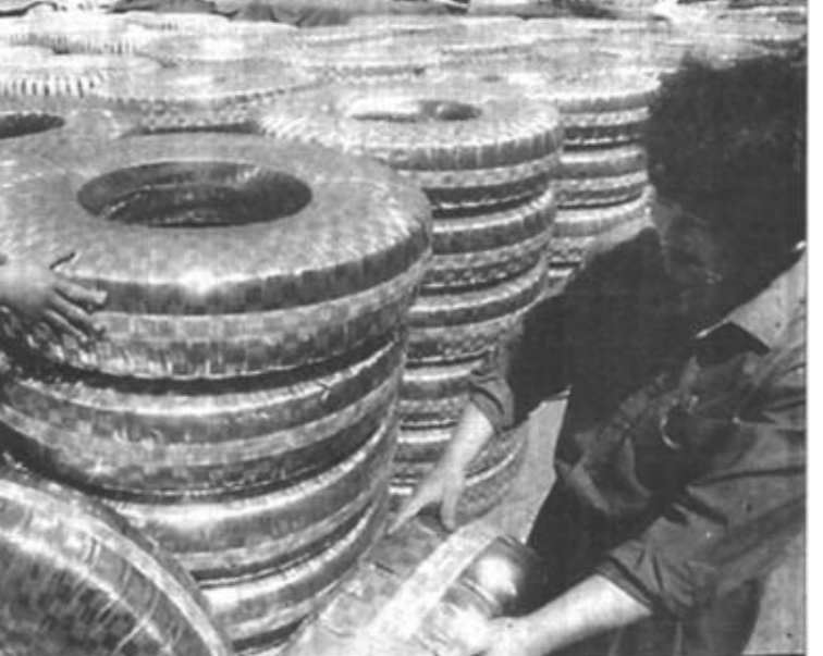
东营市西水集团华泰橡胶有限公司瞄准国际市场，大力提高产品包装水平，使该厂生产的产品“三A”牌轮胎一次性通过ISO9001生产体系认证和产品质量认证，并取得了自营出口经营权。(崔丽英撰)

目前相当一部分企业存在着“一线紧、二线松、三线肿”的状况，职工盼望通过深层次的改革实现企业经济效益的提高和真正的按劳分配。这表明，深化改革有着广泛的群众基础，但要真正把群众动员起来投身改革，还要做好细致的思想政治工作。具体说，就是要启发职工参加改革的意识；让广大职工群众参与改革方案的制定、实施的全过程，充分发挥职代会的作用。 深化改革中的思想政治工作要树立新观念。针对当前深化企业改革必须解决的一部分职工传统观念比较陈旧和“一切向钱看”的思想，要下大力气在广大职工中抓好五个方面的教育，即进行社会主义优越性教育、社会主义按劳分配教育、主人翁地位教育、国家、企业、个人三者利益关系的教育、社会主义市场经济的教育。